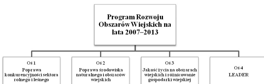
Rysunek 1. PROW w podziale na osie priorytetowe